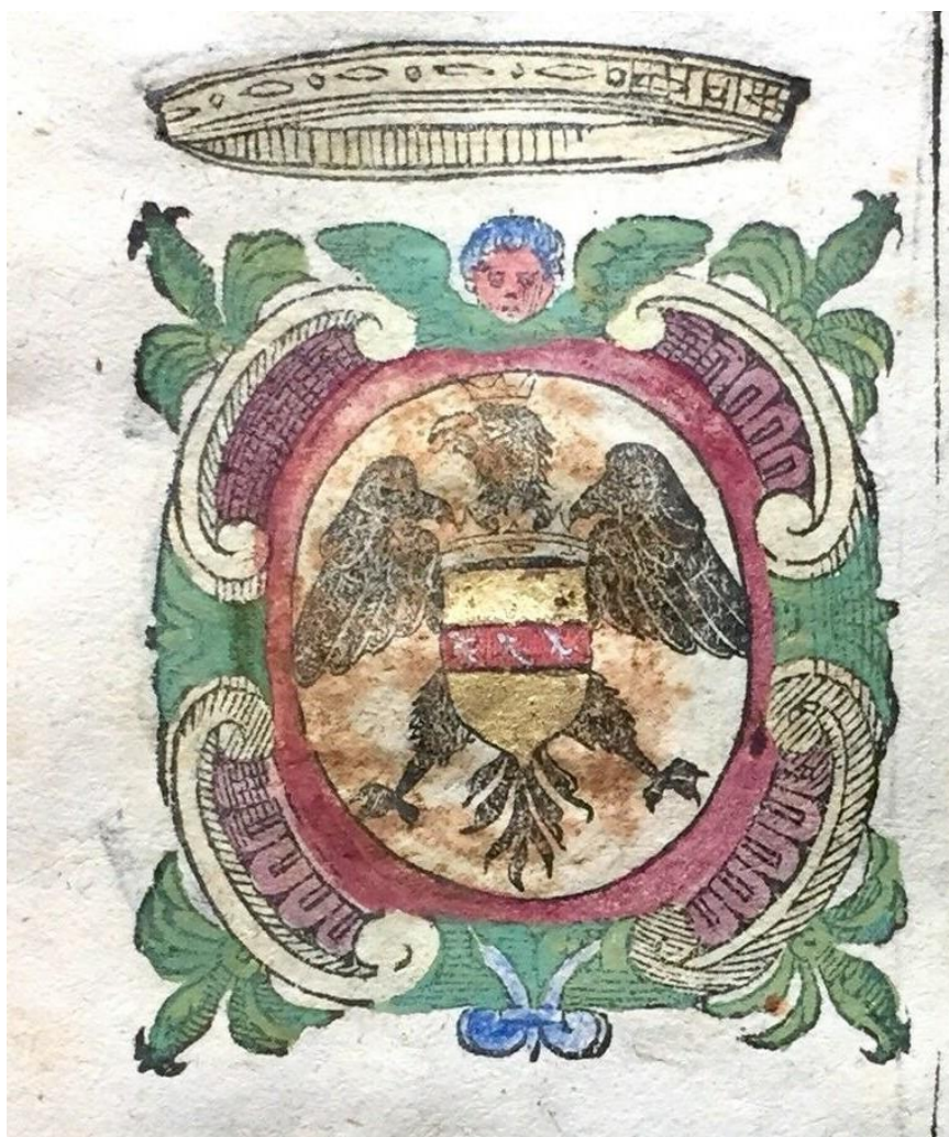
Arme degli Spinelli Marchesi di Cirò.

Facebook Twitter Pinterest to WhatsApp Messenger Email