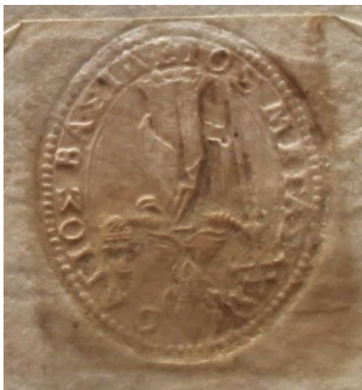
Sigillo della congregazione di S. Basilio.

Il 15 agosto 1695. Apollinare Agresta abate generale dei Padri Basiliiani da Messina, scrive al principe di Tarsia. Egli si compiace di potere servire il principe con la concessione della reliquia di San Diodemo.